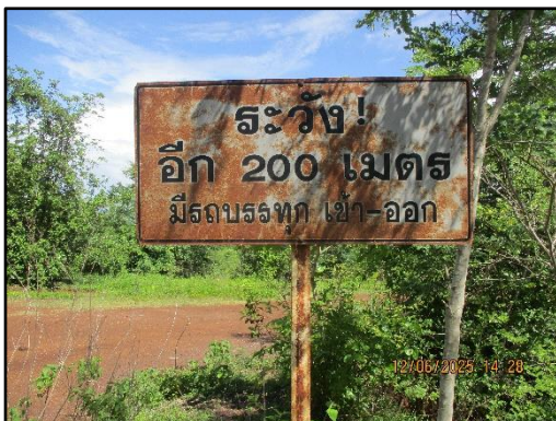
ภาพที่ 2.5 ป้ายสัญญาณจราจรมีรถขนส่งแร่เข้า-ออก ของพื้นที่โครงการ