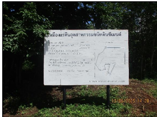
ภาพที่ 2.9 ป้ายประทานบัตร