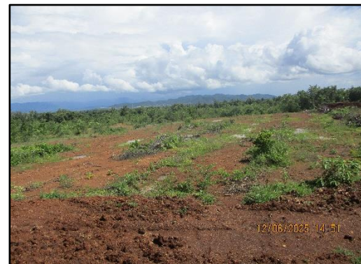
ภาพที่ 2.10 สภาพปัจจุบันของพื้นที่โครงการ