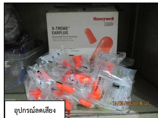
ภาพที่ 2.12 Stock อุปกรณ์ป้องกันอันตรายส่วนบุคคล