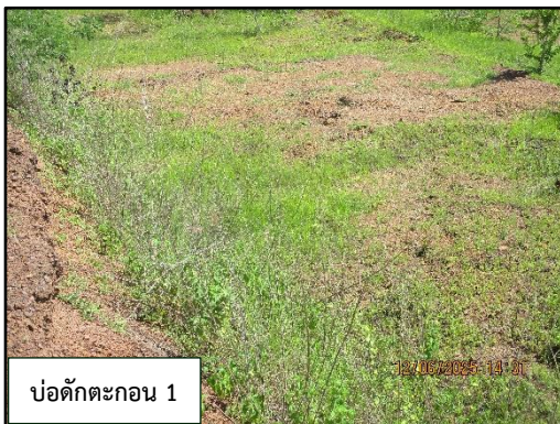
บ่อดักตะกอน 1