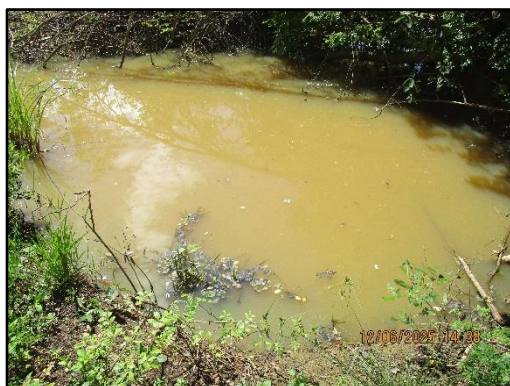
ภาพที่ 2.13 บ่อรับน้ำ Sump บริเวณพื้นที่โครงการ