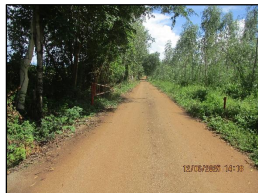
ภาพที่ 2.14 เส้นทางลำเลียงแร่ภายในโครงการ