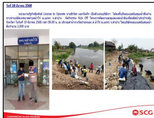
ภาพที่ 2.16 กิจกรรมการมีส่วนร่วมกับชุมชน