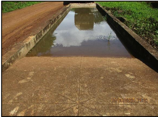
ภาพที่ 2.7 บ่อล้างล้อรถบรรทุกที่ขนส่งแร่