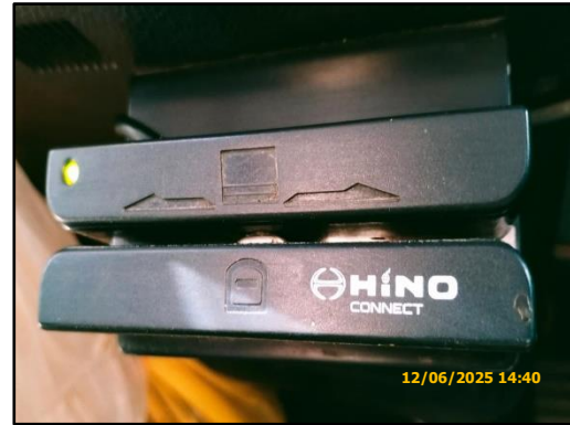
ภาพที่ 2.15 รถบรรทุกปิดคลุมผ้าใบและติดตั้งระบบติดตาม GPS