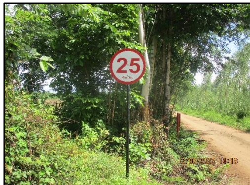
ภาพที่ 2.11 ป้ายจำกัดความเร็วไม่เกิน 25 กิโลเมตร/ชั่วโมง