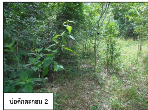
บ่อดักตะกอน 2