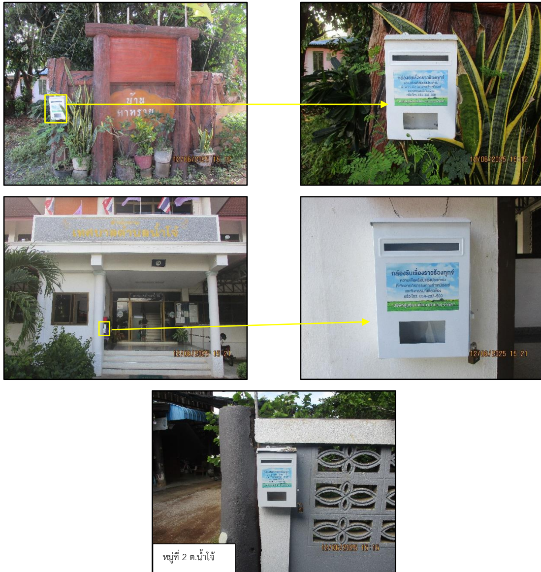
ภาพที่ 2.1 กล่องรับเรื่องราวร้องทุกข์/ความคิดเห็น