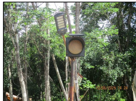
ภาพที่ 2.6 สัญญาณจราจรไฟกระพริบทางเข้า-ออกของพื้นที่โครงการ