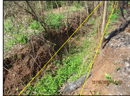
ภาพที่ 2.3 คั่นดินและระบายน้ำพื้นที่โครงการ